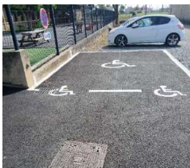
Création d'un emplacement réservé pour personnes à mobilité réduite devant la cour de l'école