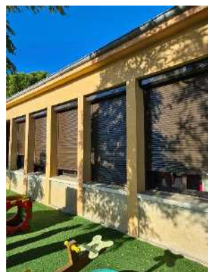
Mise en place de ventilateurs et pose de volets roulants à l'école